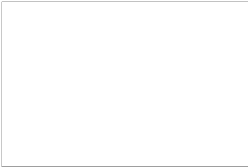
Springreiten mit festen Hindernissen

Das Westport Woods Hotel & Spa verfügt über einen eigenen Reitstall, der sich in Knappagh , etwa 8 km vom Hotel entfernt befindet. Als Service steht ein kostenloser Transfer zwischen Hotel und Reiterhof zur Verfügung.