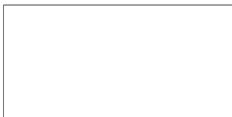
Einblick in den Fitnessbereich

Der Wellnessbereich „ YonKa “ ist eine Oase der Entspannung. Man kann hier eine Gesichts- oder auch Ganzkörperbehandlung erhalten. Selbstverständlich werden auch Massagen angeboten. Eine Massagebehandlung ist perfekt geeignet um seinen Muskeln nach einem langen Ausritt eine Entspannung zu gönnen. Besonders angenehm ist ein Besuch des „ Hot Tub “ - ein heißes Bad in einem Holz-Whirlpool im Freien.