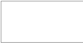
Blick ins Schwimmbad

Weiterhin verfügt das Hotel über eine Kinderbetreuung für Kinder zwischen 5-12 Jahren sowie einem Kinderspielplatz .